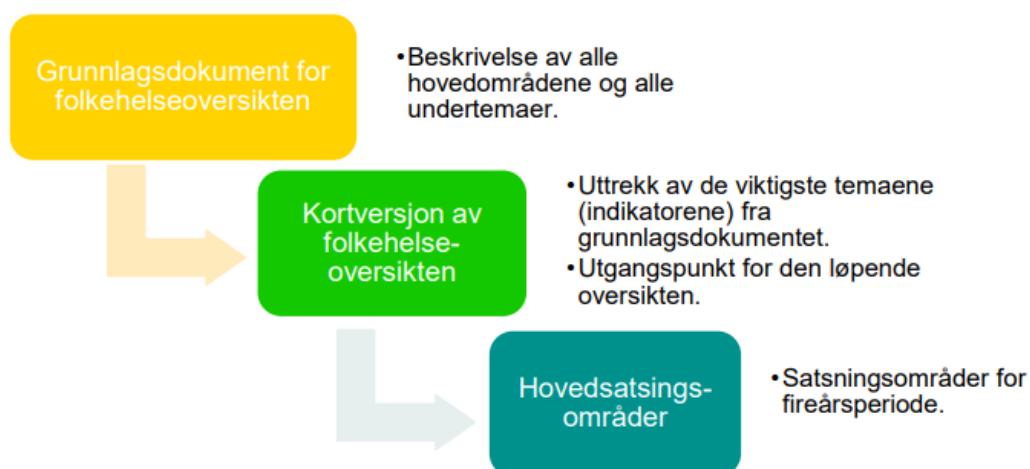
Figur: Oversikt over dokumentene i folkehelseoversiktsarbeidet.

På bakgrunn av folkehelseoversikten skal det lages en kortversjon (lysgrønt i figur under) som formidler hvilket løpende oversiktsarbeid som foregår i periodene mellom fireårsintervallene. Kortversjonen vil foreslå prioriterte områder, og er ment til å ytterligere tydeliggjøre utfordringsbildet i folkehelsearbeidet. Kortversjonen planlegges utarbeidet i 2024/2025.